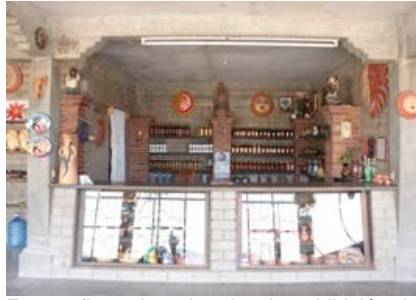
Fotografía 6. Area interior de exhibición del mezcal.