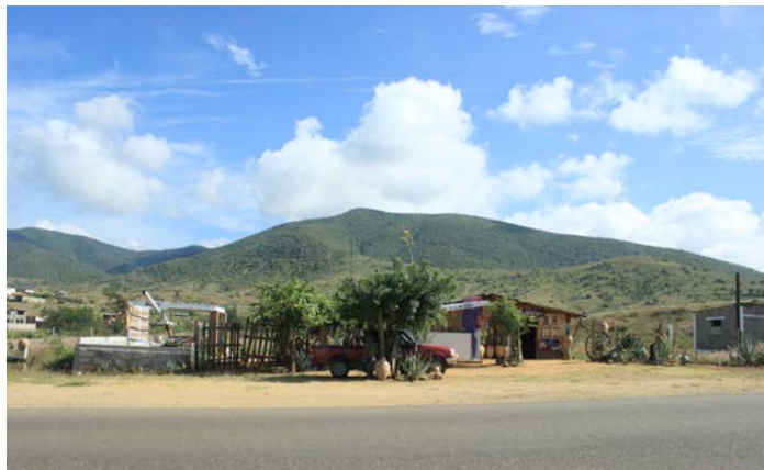
Fotografía 1. Paleque "La Espina dorada".

Todo esto introduce otro concepto importante: el Paisaje como memoria . La memoria es la historia, es la tradición cultural específica de una comunidad de un lugar y constituye un elemento integrador y generador del Paisaje. Sin memoria no existe el paisaje y sin paisaje no existe el arte y la arquitectura del lugar. Todo está estrechamente relacionado.