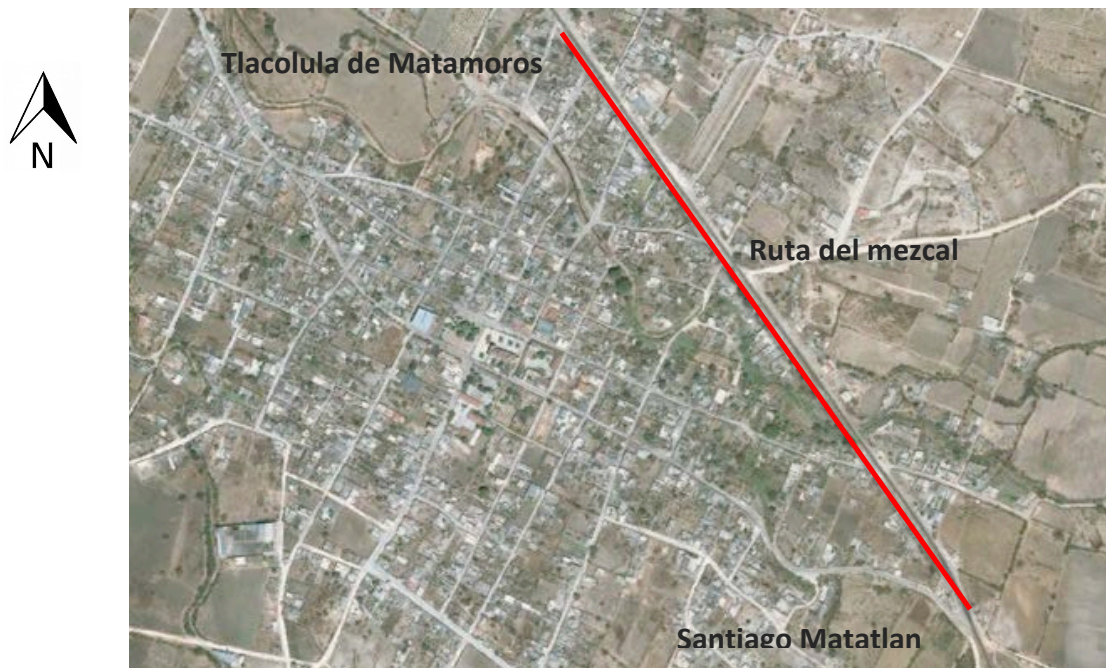
Imagen 1.- Ubicación de la ruta del Mezcal en Valles Centrales de Oaxaca.