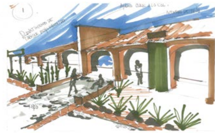
Figura 1 y 2 Bocetos realizados por el Arq. Enrique Méndez Sosa, en el curso impartido a los estudiantes de la Escuela de Arquitectura de la URSE, para desarrollar propuesta sobre el mejoramiento de palenques.