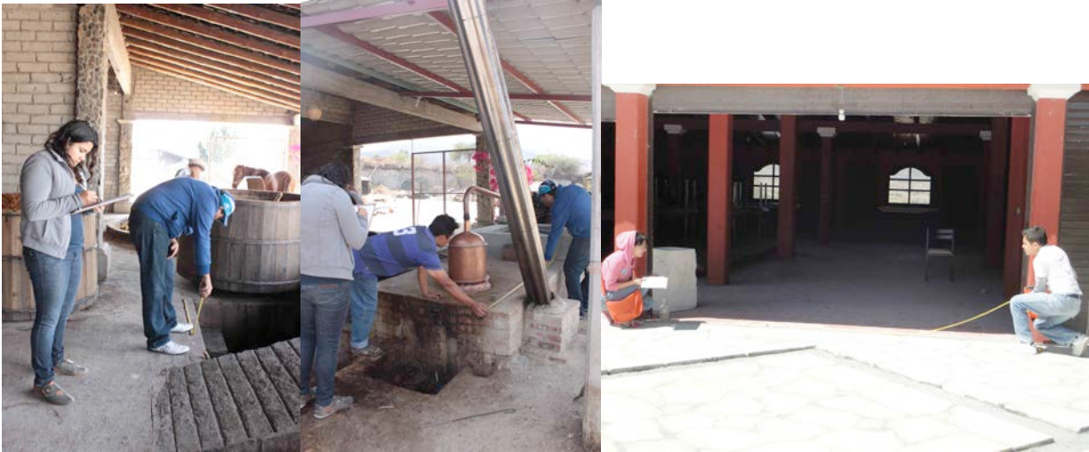
Fotografías 10, 11 y 12. PASC/2013. Alumnos realizando levantamiento arquitectónico de los palenques.