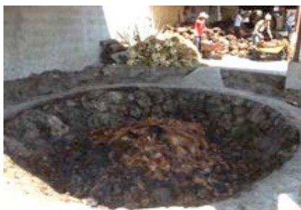
Fotografía 2.- Cocimiento del maguey

La producción de mezcal en partes de la entidad oaxaqueña es el resultado de conocimientos transmitidos de generación en generación. Los mezcaleros o palenqueros (a la destilería se le conoce en Oaxaca como palenque) han incorporado nuevos elementos para mejorar la elaboración del destilado de agave, pero conservando en esencia el sistema aprendido siglos atrás.