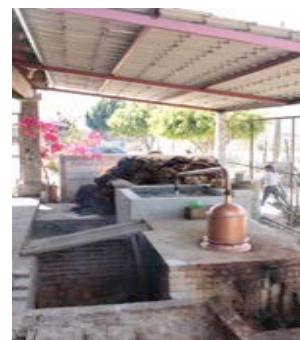
Fotografía 4. Destilación PASC/2013.