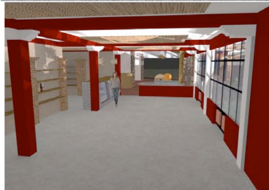
Fotografías 8 y 9. PASC/2013. Imágenes 3 y 4. Propuesta de mejora para palenque exterior e interior.