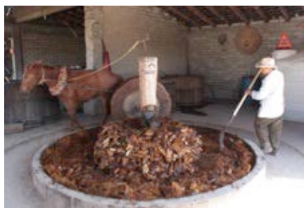
Fotografía 3.- Molienda