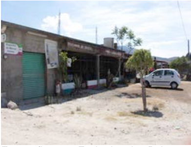
Fotografía 5.- Fachada de Palenque